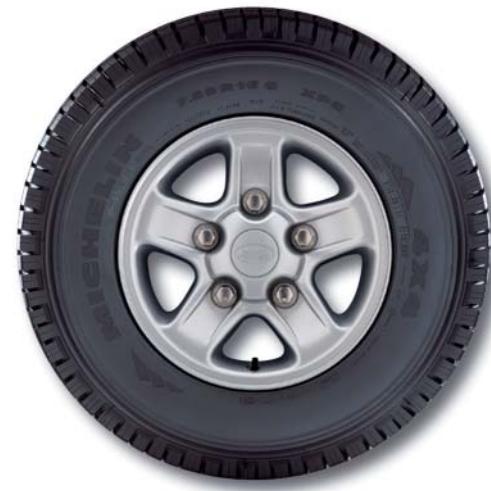
Leichtmetallfelge „Boost“ 7J x 16