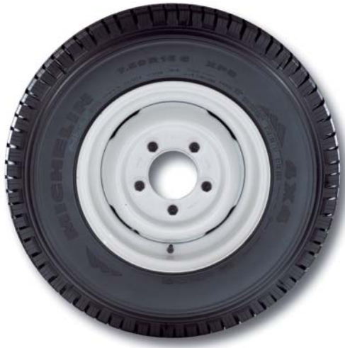
Stahlfelge (Serie bei 90/110) 5.5F x 16