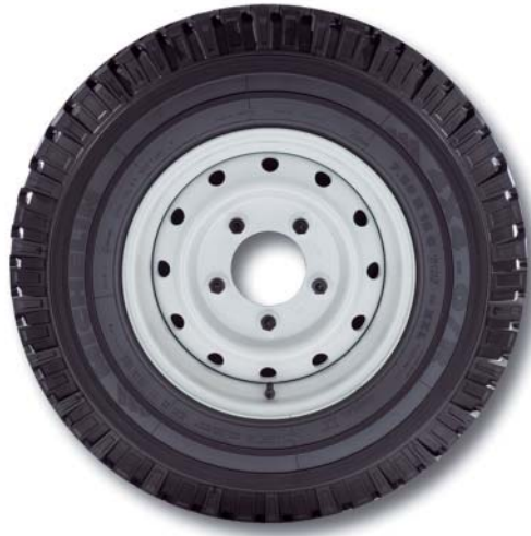
Stahlfelge (Serie bei 130) 6.5J x 16