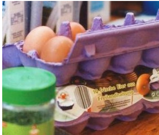
Und die Eier sind immer noch ganz.

Danach dann erstmal Urlaub in den Bergen, die wir gerade durchgeilt haben. Ohne das Motorengerumm überall wirkt es irgendwie anders. Ausklang der Veranstaltung mit viel Sonne, endlich können wir auch die Klamotten trocknen.