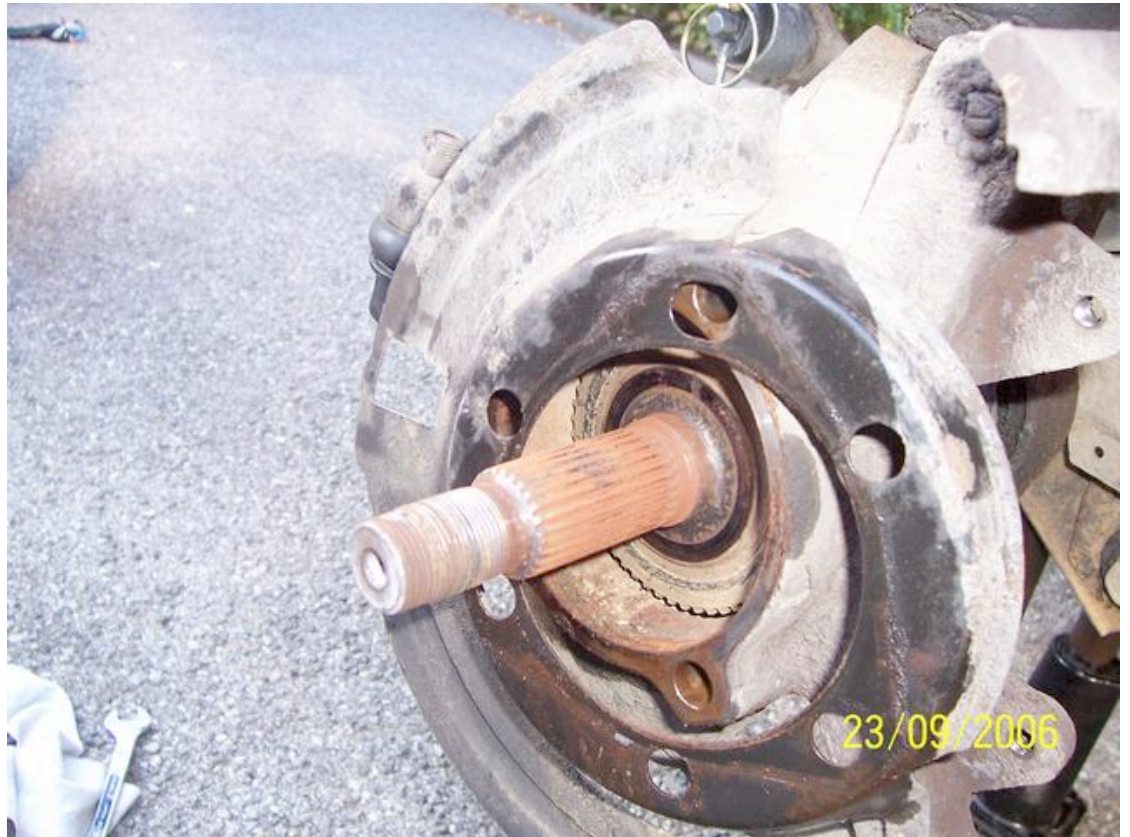
Hier ohne Bremsenschutzblech