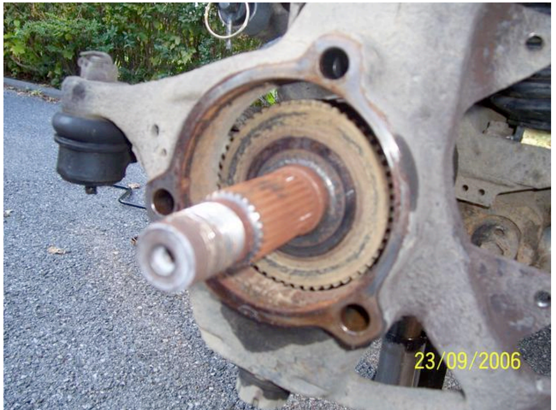
Die Steckachse einfach rausziehen Sieht dann so aus